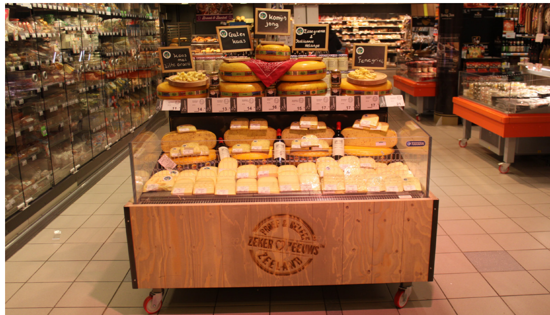
Voor een Zeeuwse vestiging van Albert Heijn is de signing voor stands, waar lokale producten werden gepresenteerd, verzorgd. De houten panelen van de stand zijn voorzien van gegraveerde logo's en teksten.