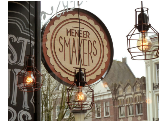
Voor Meneer Smakers verzorgde men een totaalconcept. Ontwerp van servethouders, kasten, displays, menukaarten en het realiseren van verschillende logo's voor zowel binnen als buiten. Voor dit uithangbord is de metalen ring door een externe partij gemaakt. Laserbeest maakte het logo uit lagen van multiplex, gebeitst in de juiste kleuren en verlijmd deze lagen waarna het geheel in de lak is gezet om het weersbestendig te maken.

Wie rondkijkt in het pand aan de Abtswoudseweg, krijgt een goed beeld van wat Laserbeest in huis heeft. Letterlijk en figuurlijk. Van de handvatten van keukenkastjes tot bijzondere lampen tot houten menuborden tot signing. Raat: “We profileren ons niet sec als signbedrijf, maar het maakt wel een groot onderdeel uit van ons bedrijf. Vaak gaat het om bijzondere opdrachten voor bedrijven die eens wat anders willen dan een standaard gevelbord of display. Doordat we allemaal een ontwerpachtergrond en veel kennis van de materialen en lasersnijtechniek hebben, rolt uit het idee van de opdrachtgever meestal wel een aparte en creatieve oplossing. Daarnaast krijgen we ook ontwerpen aangeleverd waarbij we dan alleen de tekeningen hoeven aan te passen. Het zijn niet alleen enkele stuks opdrachten die we vervaardigen. Ook grote opdrachten gaan we niet uit de weg. We hebben een behoorlijk