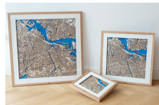
Eigen product: WoodMaps. Mooi vormgegeven stadskaarten die opgebouwd zijn uit 3 lagen die staan voor water, land en wegen. De kaarten zijn in ingelijst in een massief eiken lijst.