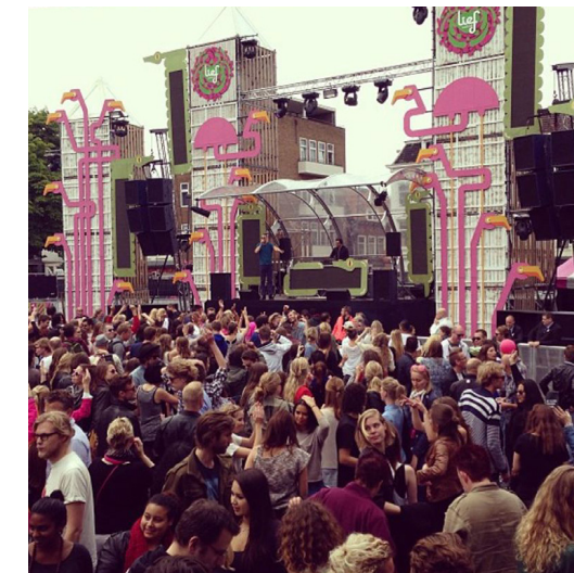
Voor het liefestival heeft Laserbeest voor verschillende edities meegewerkt aan de aankleding. Het verzorgde de bewegwijzering over het festival terrein, de plattegronden, locatie aanduidingen. Maar het mooiste project voor het Lief festival was toch wel de aankleding van de podia. Metershoge flamingo's gemaakt uit meerdere lagen MDF om een 3D effect te bereiken.