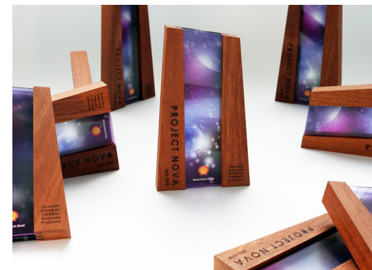
Voor Shell deze licht mystieke award. De drie plaatjes die ingeklemd zijn tussen de twee houten staanders zijn half doorschijnend en genereren een 3d effect van een galaxy wanneer licht van achteren schijnt. De plaatjes hebben een verschillende print waardoor dat effect ontstaat. De op maat gemaakte houten items zijn voorzien van een donkere gravure en in de olie gezet.