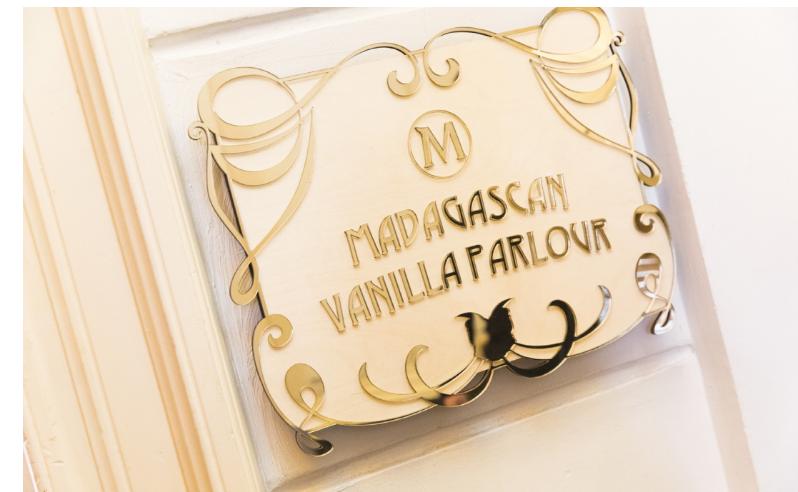
Voor Tasty Lemon de signing voor de Magnum Experience. Op een multiplex achtergrond werden gouden spiegel acrylaat letters en vormen verlijmd.

machinepark en met de meeste materialen op voorraad kunnen we snel leveren. Wat betreft signing werken we ook samen met andere partijen zoals printbedrijven die materialen kunnen bedrukken. Daarnaast zijn we ook wel eens toeleverancier voor signbedrijven betreffende acrylaatletters voor bijvoorbeeld lichtbakken. Als Laserbeest zijn we voortdurend op zoek naar nieuwe segmenten in de markt. Zo hebben we stadsplattegronden in een reliëf van hout ontwikkeld die men als een schilderij aan de muur kan hangen en vanaf juli online kan bestellen via onze website woodmaps.nl.