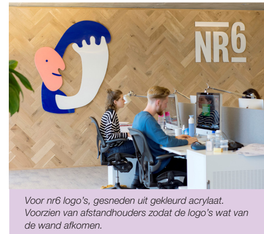
Voor nr6 logo's, gesneden uit gekleurd acrylaat. Voorzien van afstandhouders zodat de logo's wat van de wand afkomen.