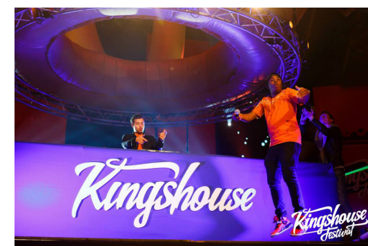
Voor het Kingshouse festival in de Jaarbeurs maakte Laserbeest een groot logo dat op de DJ booth werd gehangen. Het logo is 2 meter breed en gemaakt van multiplex.